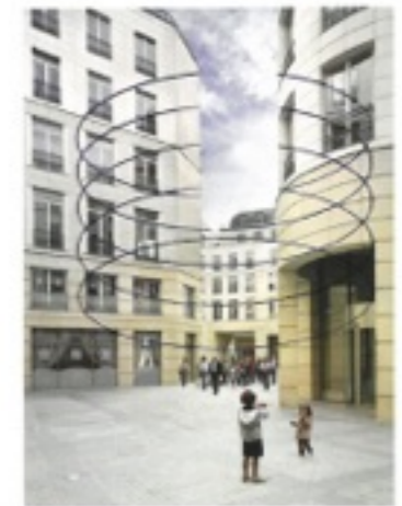
Cinq ellipses ouvertes