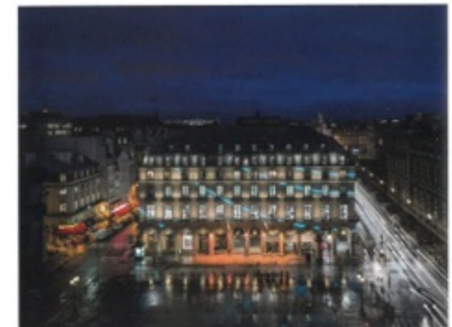
François Morellet MC 3